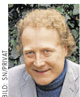
„Isolation schwächt auch biologisch.“ Joachim Bauer, Neurowissenschaftler

Das Bedürfnis nach liebevoller Zuwendung und zwischenmenschlicher Resonanz bleibt das gesamte Leben hindurch lebendig. Erwachsene können sich, um das Maß an Liebe zu bekommen, das sie sich wünschen, aber autonom betätigen.